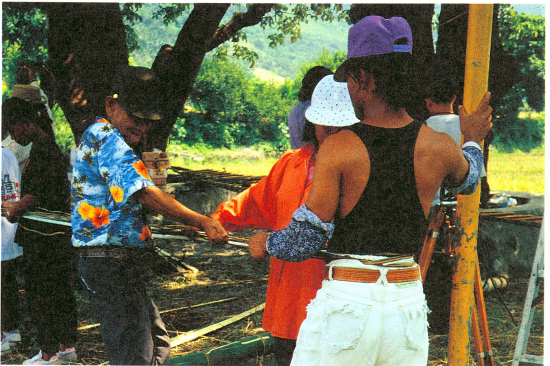
圖版六：男女青年合作定出秋千索的中點