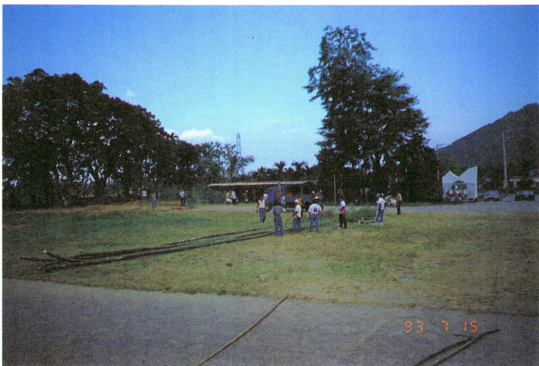
圖版四：顧問和青年挑選取回的刺竹（近鏡頭左起第二位為顧問）