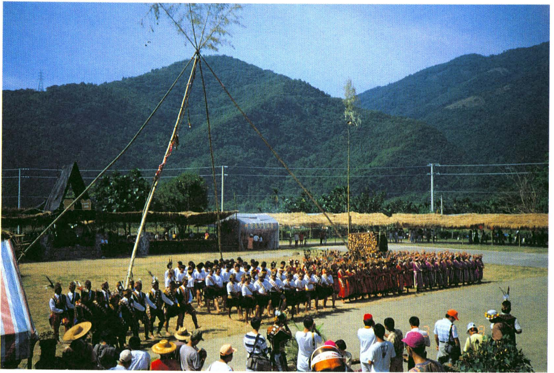
圖版十四：豐年祭大會的開幕儀式