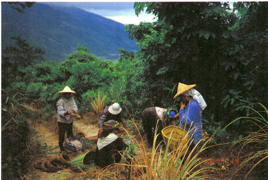
圖版三：在路旁整理採得的籐