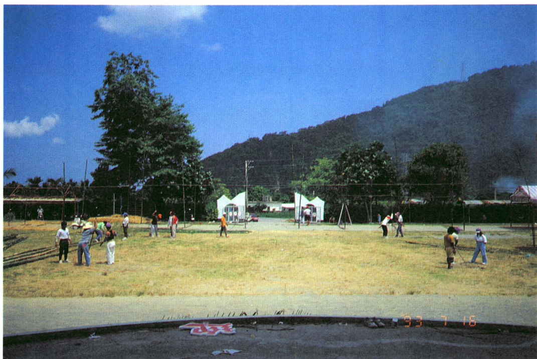
圖版九：青年分組挖出立秋千支架的洞