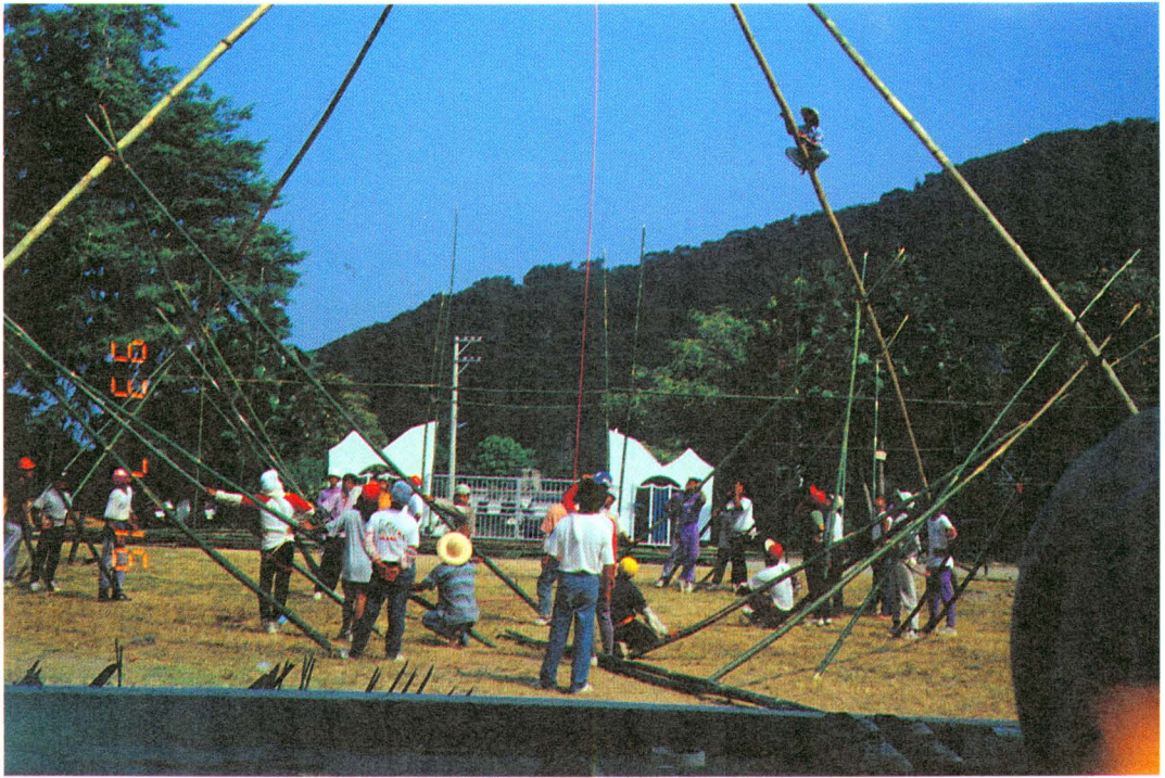
圖版十一：垂下紅繩吊起秋千索