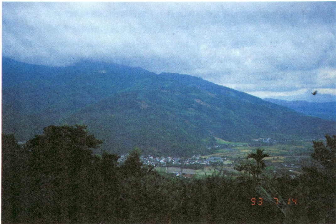
圖版一：自採籐處眺望大南本聚落