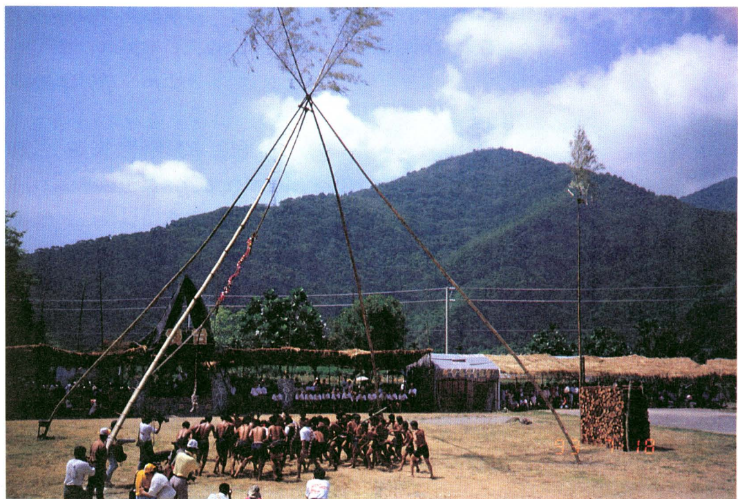
圖版十六：新青年表演節目之一——刺殺獵物