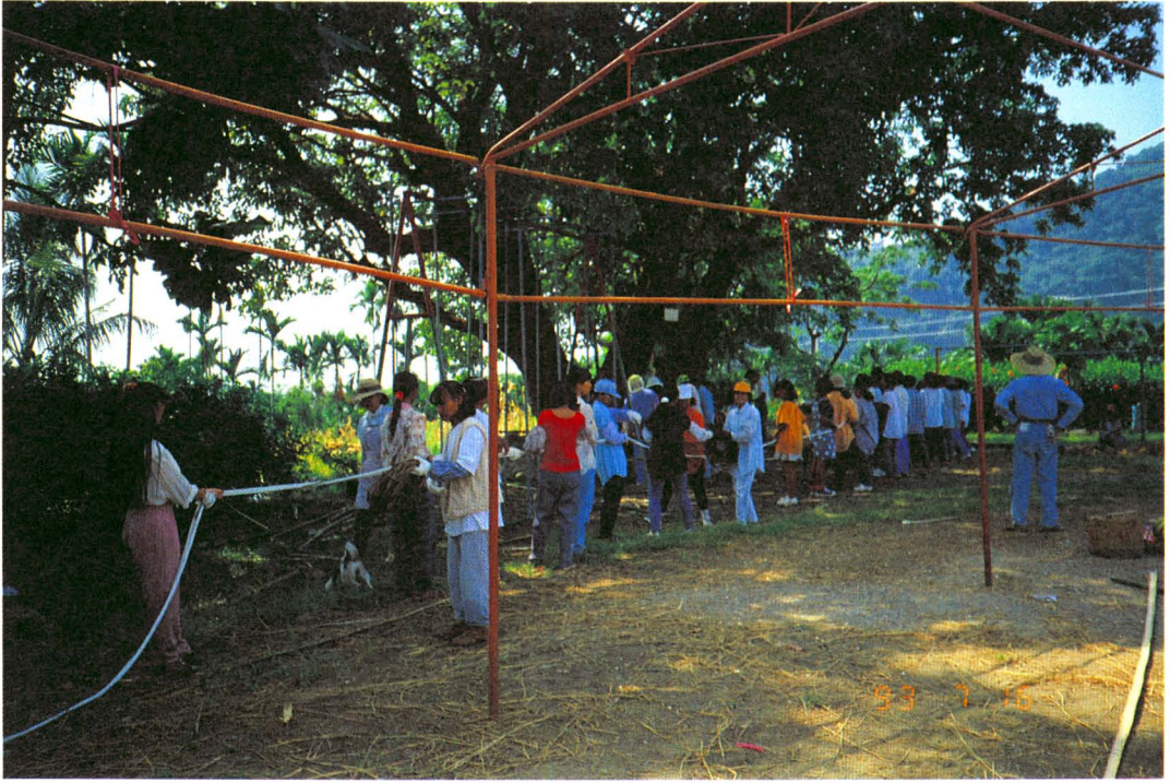
圖版七：整理秋千索內的白綿繩