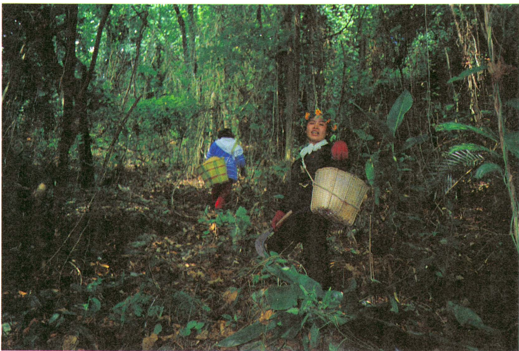
圖版二：女青年入山採籐