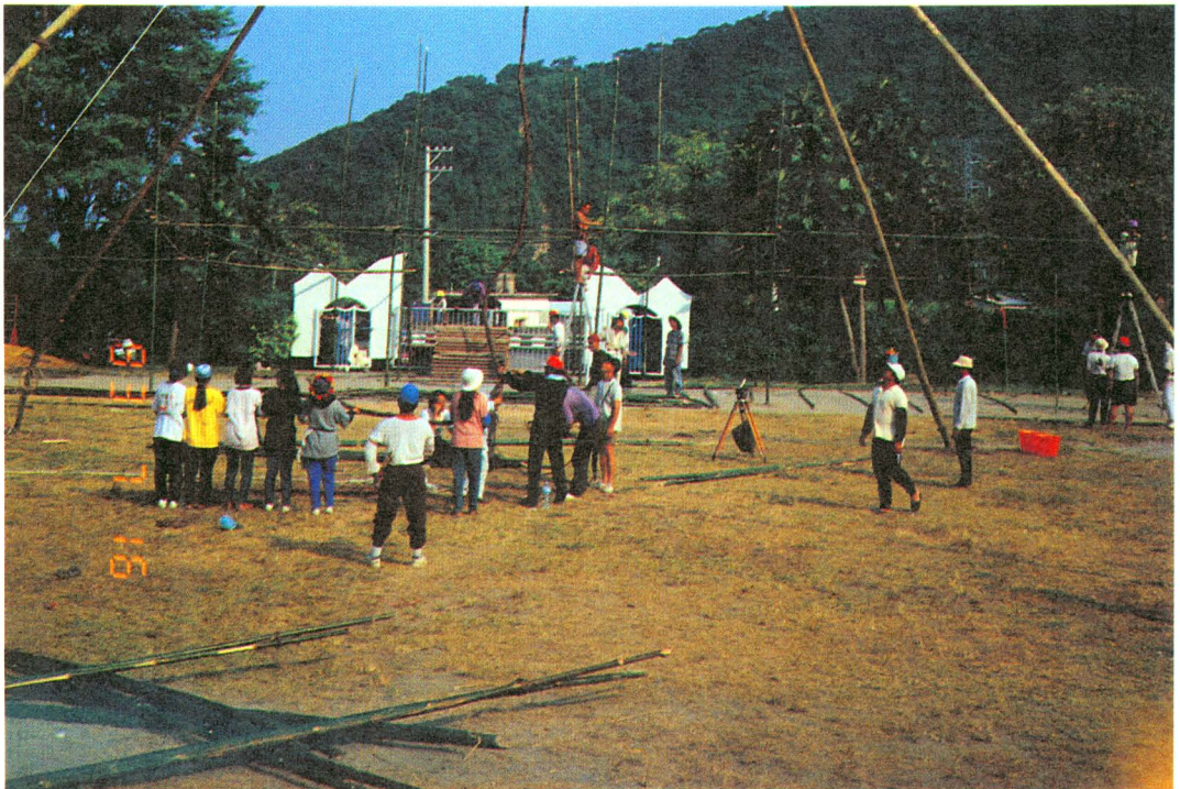
圖版十二：秋千索吊起