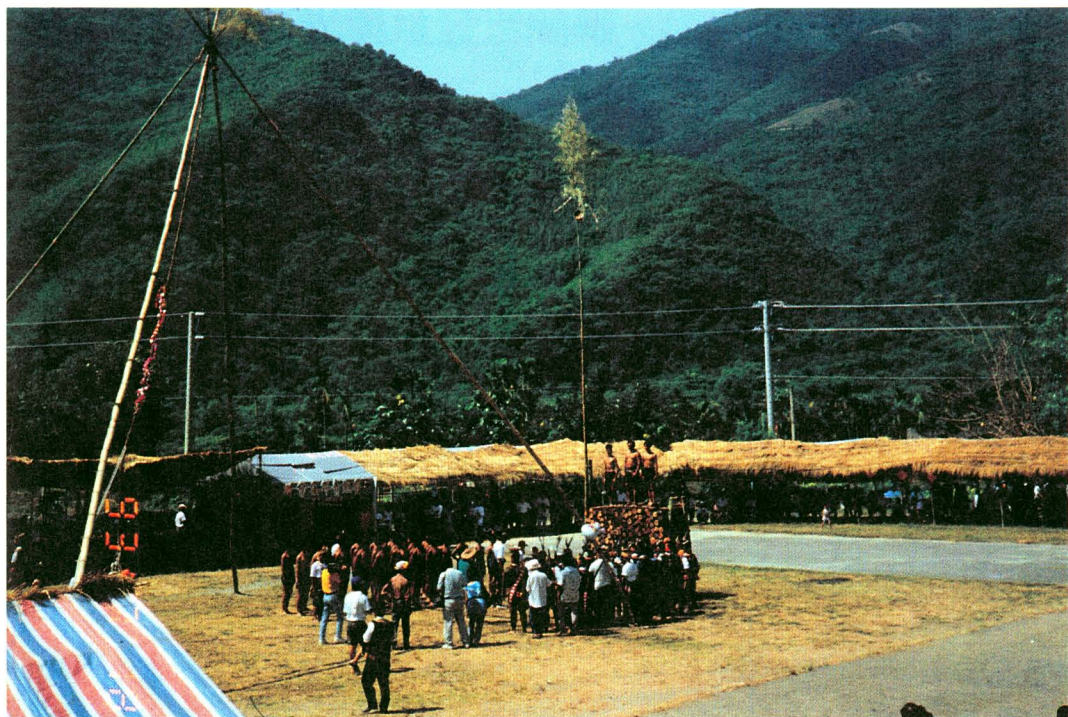
圖版十五：行完成年禮的新青年在柴堆上歡呼