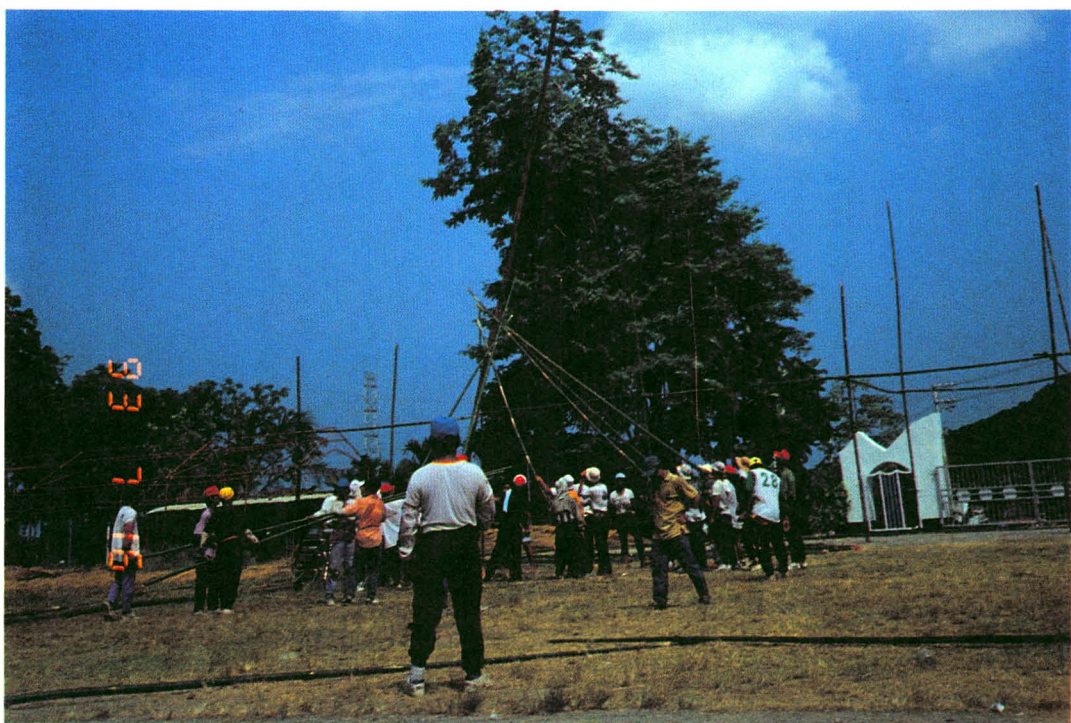
圖版十：豎立「母的」秋千架（中立背對鏡頭者為顧問）