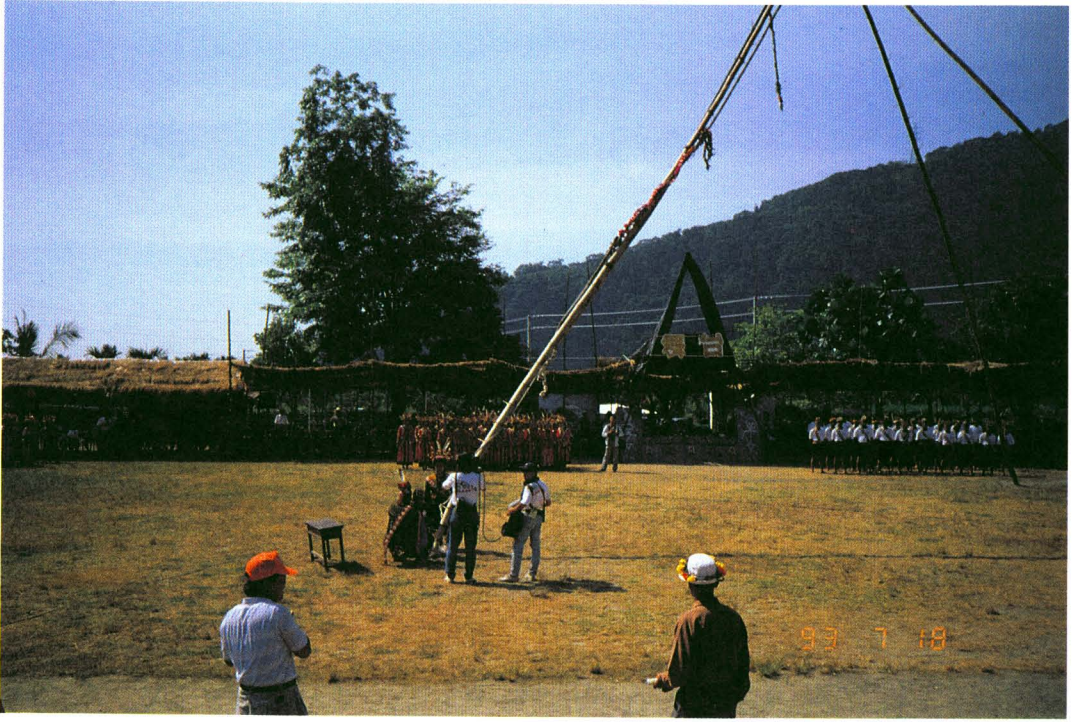
圖版十三：lapalius 家頭目兄弟作祭祖儀式