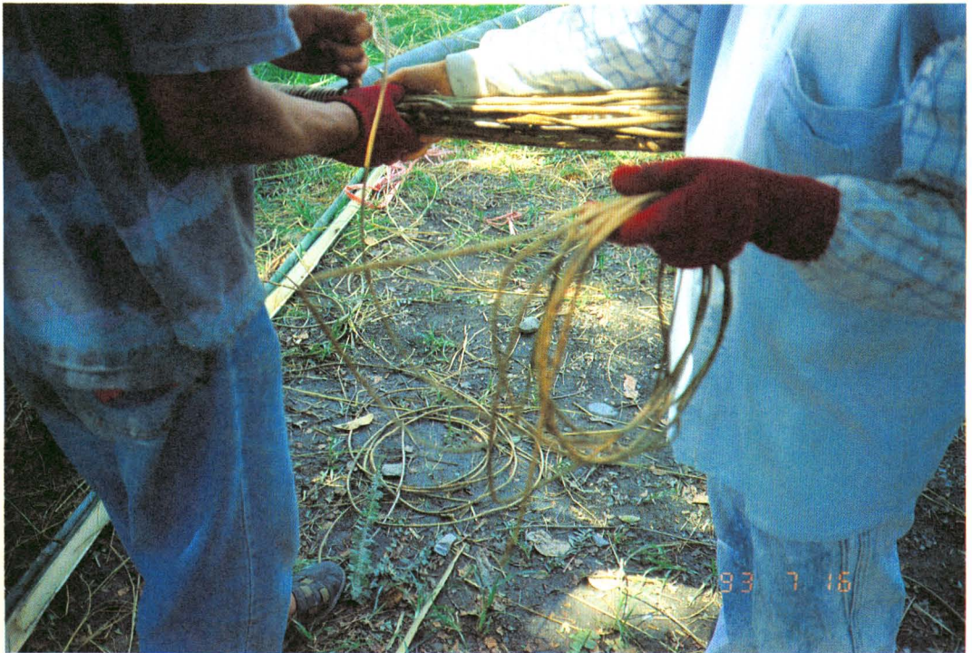
圖版八：男女青年合作以細籐纏緊粗籐及白綿繩