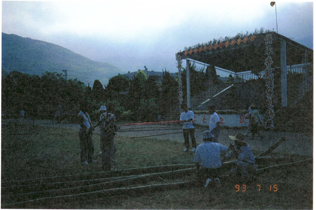
圖版五：顧問指導青年測量刺竹長度