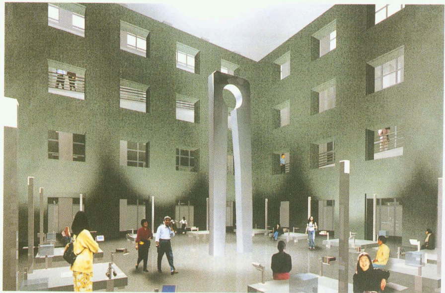
■國立台灣史前文化博物館展示中庭透視圖