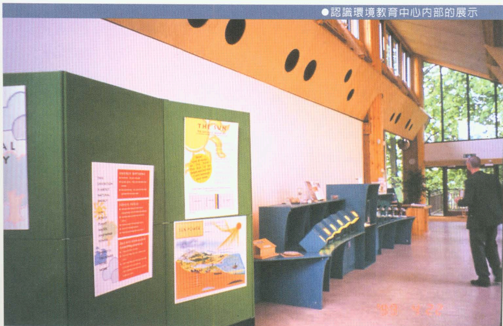
● 認識環境教育中心內部的展示

認識環境教育中心於 1996 年 10 月正式開放。該中心的成立緣起於 1994 年，當時賀尼曼博物館的理事會認為，應該有一棟館舍可以彰顯博物館的宗旨，建築物本身應反映人、環境與科學交互關係的理念，並且提供展示和教育的功能。在這樣的構想下，理事會決議在賀尼曼博物館的西側