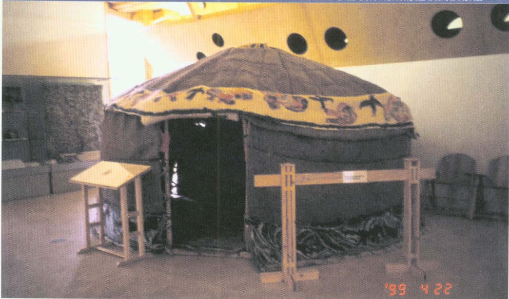
●在專家協助下，由社區學童製作而成的遊牧民族帳棚