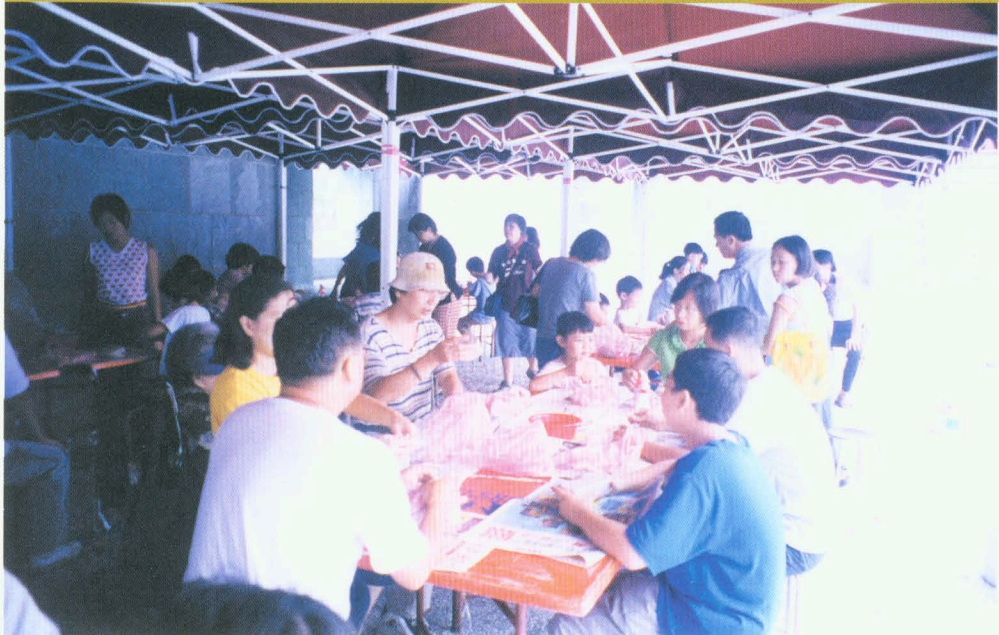
●「動手樂陶陶」假日親子活動的情景

展品運抵本館後，特展室的安全系統設有火警警報系統，以及監視器、數位錄影機、展示櫃玻璃震動感知器等盜警系統。本特展駐衛警勤務委外辦理，包含警衛室駐衛警保全、特展室駐衛警保全、動線出入口駐衛警保全等三類，工作項目區分為：一、特展警衛室監控系統執勤與特展