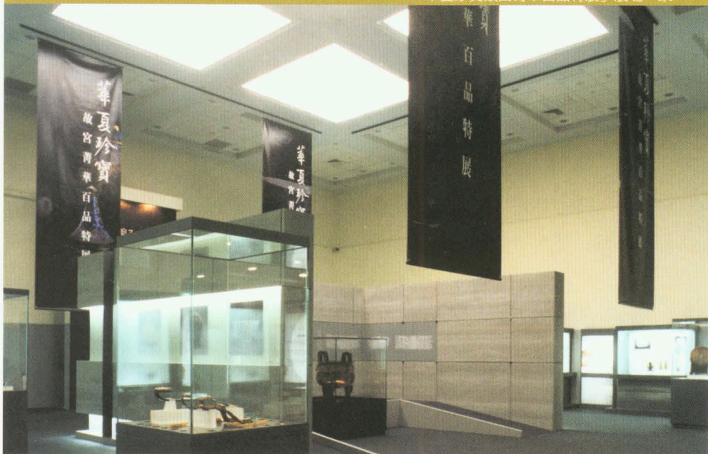
●「華夏珍寶故宮菁華百品特展」展場一景

今三千五百多年前，正好與台東卑南遺址出土史前文物之石器、玉器及陶器等時期相當，觀眾據此可對照中原與海島文明的特色。玉器主要有距今五千餘年內蒙古草原東部紅山文化之展翅玉鳥、四千餘年前太湖流域良渚文化玉琮、四千年前後陝甘地區齊家文化玉璧、中原地區商周以降之歷代精雕玉器，乃至清初盛世經由回部傳來伊斯蘭風格之「痕都斯坦玉器」。瓷器有宋代名窯、明初洪武青花大盤、釉裏紅大碗，以及各朝與盛清名瓷。清宮珍玩則