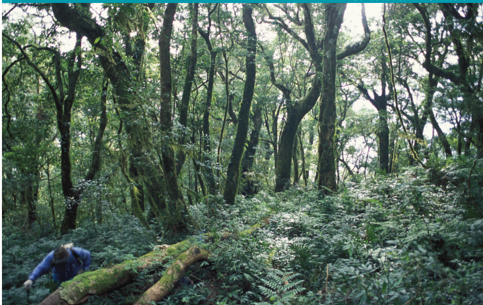
●走在肯都爾山的原始林中