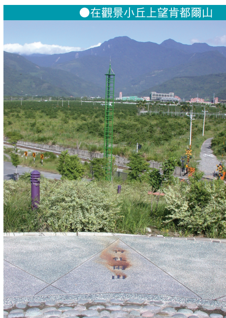
●在觀景小丘上望肯都爾山

肯都爾山這個怪異的山名是來自魯凱族的稱呼Kindoor，一般測量地圖原本譯為肯杜爾山，而後又有人稱為劍弗山者，可能亦是自此稱呼衍生之發音。Kindoor為魯凱舊社之地名，位居中央山脈東側、小鬼湖的東北方。本山自古即為大南魯凱的聖山，因為它位居東西魯凱族橫跨中央山脈連繫的要衝（此路線亦為往