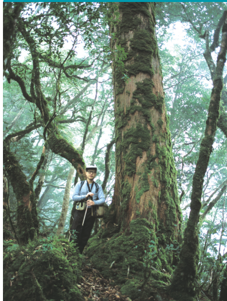
●筆者與主稜上的紅檜合影

這兩種行程，就筆者的看法是除非有萬全把握，否則不要取當天來回者。因本山經常自上午10點之後就籠罩在雲霧之中，加上海拔1500公尺以上獵路路跡不明，當天來回若稍有差池，就必然會面臨