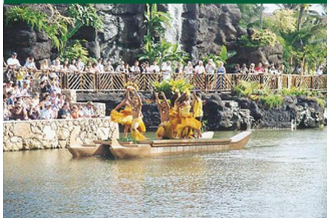
●仿南島船隻的樂舞表演，由BYU學生擔綱演出