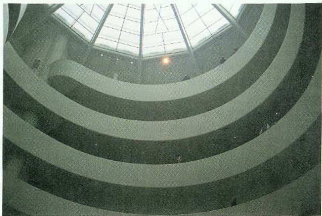
圖版二a 古根漢美術館本館螺旋狀展示坡道