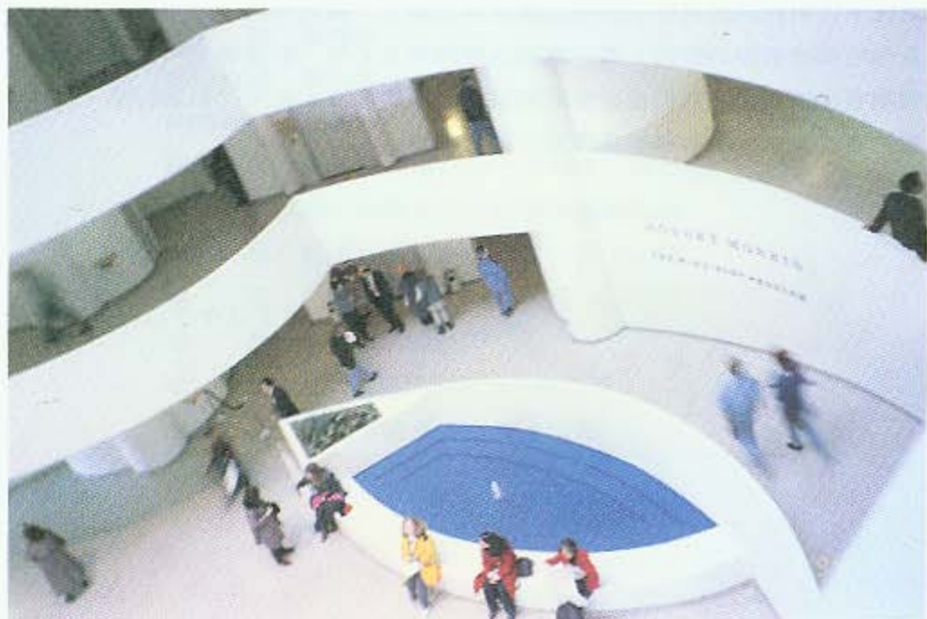
圖版二b 古根漢美術館本館中庭旁一角