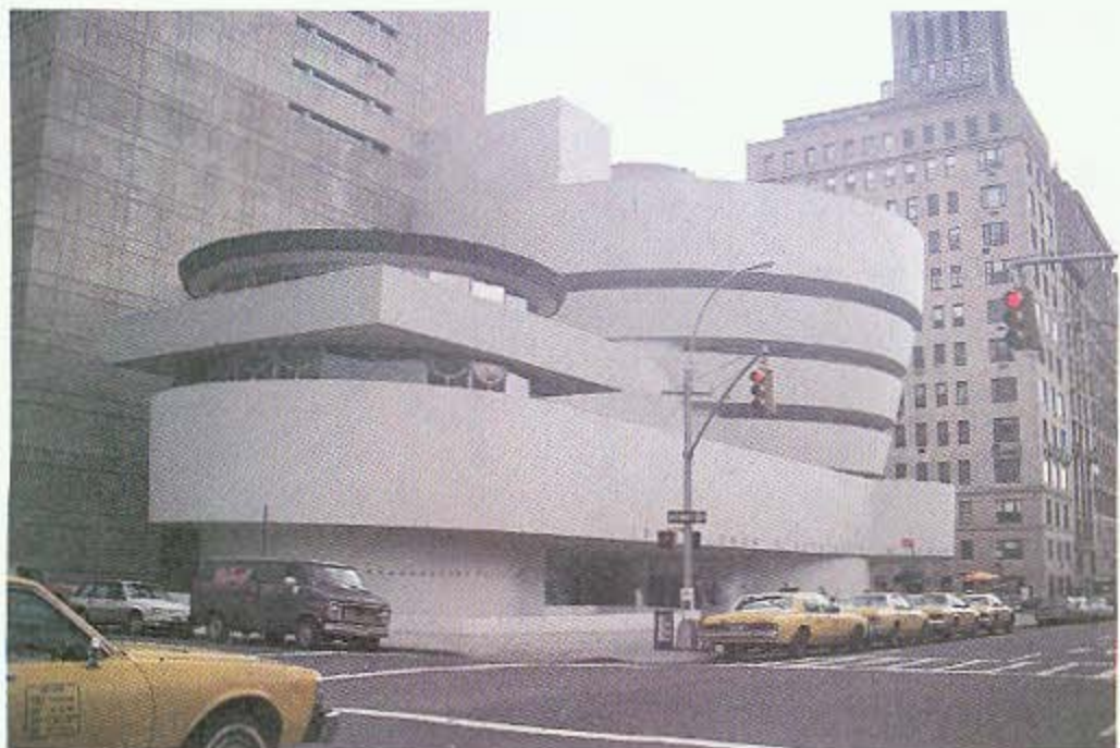
圖版一a 古根漢美術館本館外觀