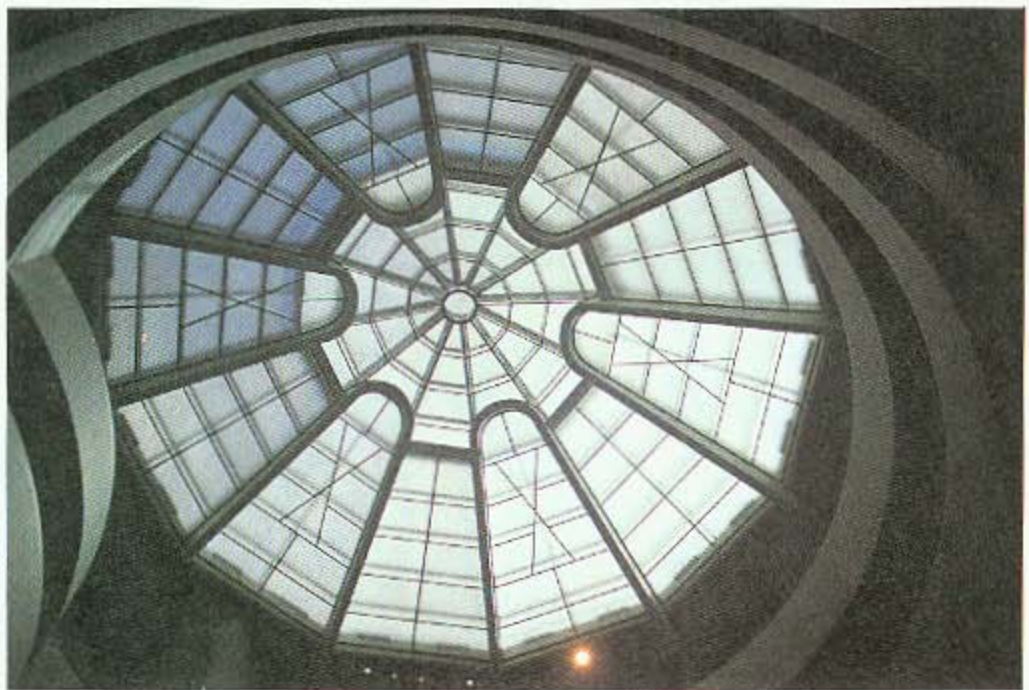
圖版一b 古根漢美術館本館內部挑高中庭採光圓頂