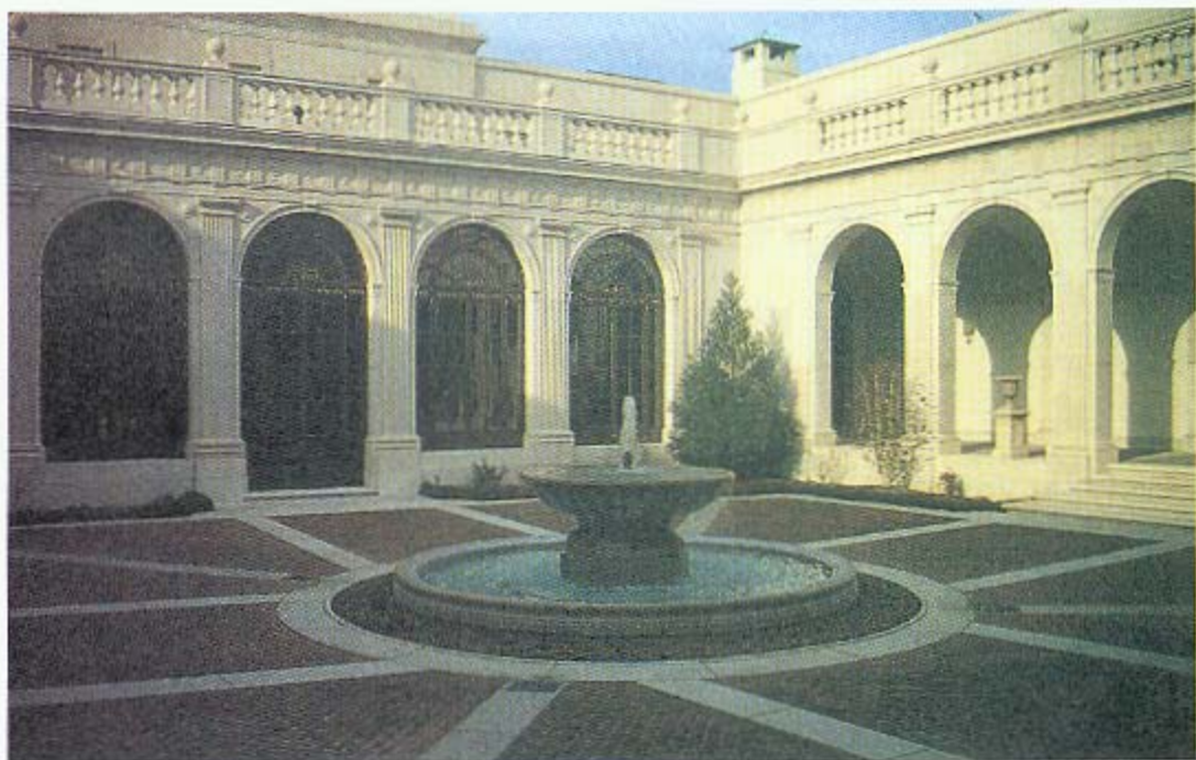
圖三、弗立爾美術館開放中庭