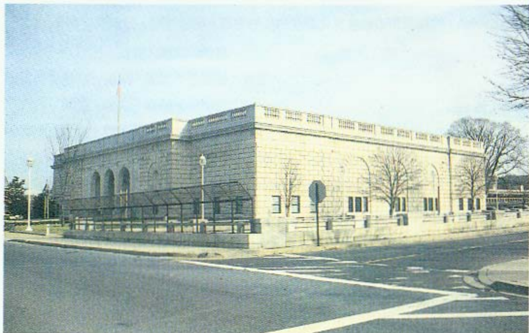
圖一、弗立爾美術館全貌