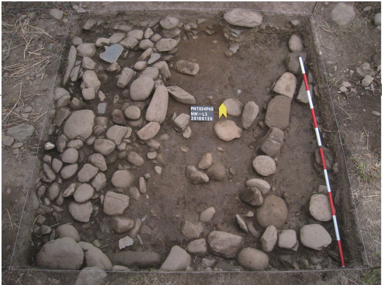
PNT024P40NW 探坑L3坑底拍照，出土史前結構現象，呈東北—西南走向。

經過兩個禮拜的勞動，雖然身體有些疲累，有些同學更是吶喊頭痛、腰痠的，但是看到辛苦挖出來的成果，包括大包小包的陶片、漂亮整齊的坑底與界牆，特別是有些組挖到了玉耳飾和其它玉飾品，同學們都覺得很有成就感，雖然因為時間的關係，我們必須在1月31日就回去，但是仍有許多人希望可以留下來繼續工作，儘管人已經回到臺北了，心仍然寄託於卑南，還是會不斷地收集相關新聞，關心後續的發掘情形。這次在卑南的考古田野，要特別感謝史前館的配合與協助，不僅被同學們認為是一趟充滿驚奇與歡樂的考古之旅，也是一種考古知識與技能上的深度學習，同時還讓我們更加親近年代悠久、內涵豐富的卑南文化。