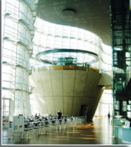
錐形建築為米其林三星的著名餐廳，每日須排隊訂位。

「提供一個靈活、高效的行政服務，以及更有效與透明化的管理措施，適當性支持、籌措國家財源的第五座國家美術館組織。」 3 。面對日本近年財政捉襟見肘，該館也花費國家財政約382億日元在建築整體，已無餘力購藏。該館建於六本木區，已盡可能結合該區的活動，將展示時間與當地商業行為的納入考量，尤其在六本木區極具名氣的三多利美術館及森美術館這兩家私人美術館 4 ，在展覽行銷及藏品已具有特色，因此企業結盟的思考模式，也成為六本木區這些美術館在定位與永續經營的可能性。