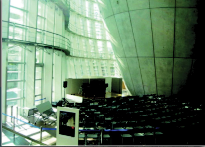
入口大廳不定期的音樂演奏

該館空間使用以地上三層、地下一層的空間設計，共有七個可靈活隔間的方正展示廳，位於一樓戶外並有三個戶外展示場，在三樓有一中型演講室及藝術圖書室，供一般民眾使用。在地下室為賣店及簡餐室。另經常成為訪客聚集的焦點處，是中庭區倒角錐型的獨立建物連接三樓平臺的獨立餐廳，標榜為米其林三星的餐廳，一、二樓為咖啡廳。在這開放性的公共區，該館所陳設的家俱，都是當代具有設計感的桌椅，而且訪客可自由將桌椅集結一區，或分散至喜好場所，沐浴在暖陽下。