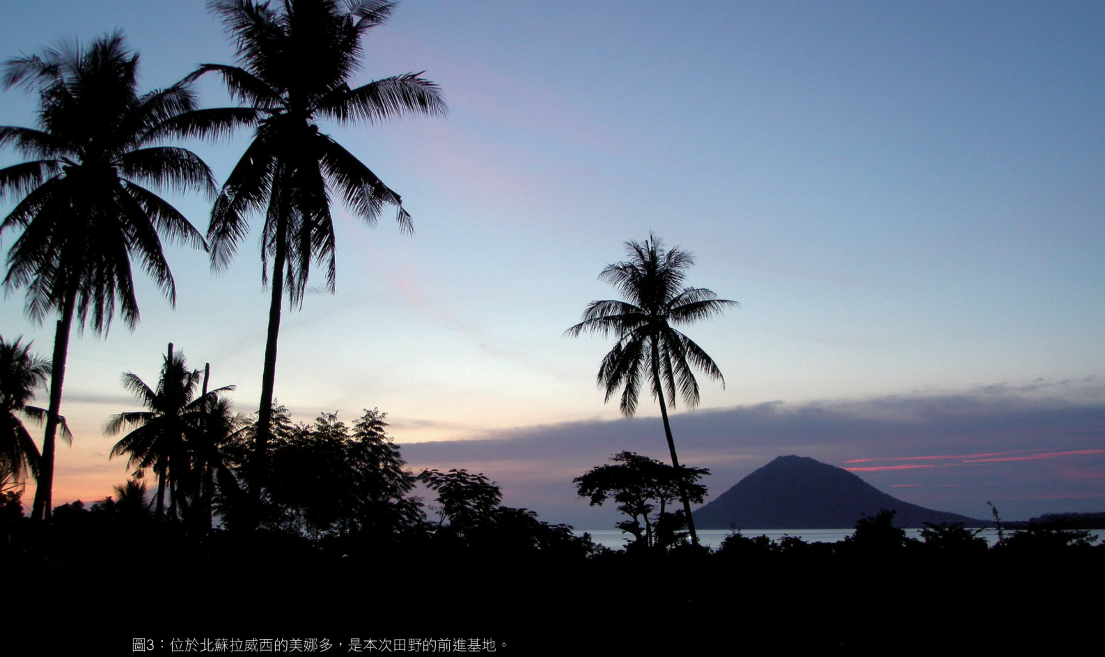
圖3：位於北蘇拉威西的美娜多，是本次田野的前進基地。

告訴我，印尼鄉下地區的衛生條件不好，尤其是飲水和蚊蟲的問題。這一聽頗令人擔憂，我要去的地方查得的資料及與印尼相關人士通信的結果都說明至少要徒步3天才會抵達那個現今還有許多製作樹皮布工作坊的Bada山谷（圖2：Bada山谷）。體能上我是沒什麼問題，但出發前要決定要帶些什麼東西？該如何打包？這些細節則準備起來頗為麻煩。首先要解決的是常備藥品，不過過去經常去山上活動的我對準備這些東西早有一套方法，所以把可能的常備良藥帶上一大盒。再來是飲水問題，我打算若飲水條件太差我就每天自己煮水帶上，所以自己要帶水袋、爐子、鍋子、耐熱水的水壺等東西。但是燃料是無法上飛機的，因此我把爐頭帶著，瓦斯或燃料打算到時再做準備。電子設備除了在城市時須考慮充電及電壓和插座規格以外，到鄉下甚至是會沒電的，因此都盡量帶著可使用乾電池的器材。