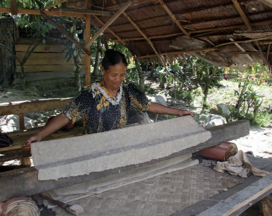
圖4：聽到製作樹皮布敲搗聲而找到的樹皮布製作報導人。