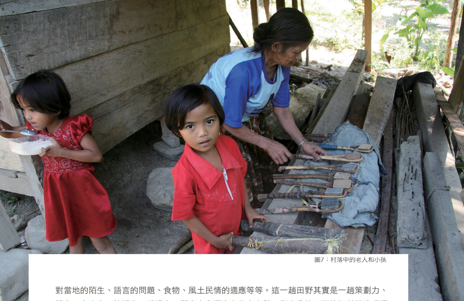
圖7：村落中的老人和小孩

對當地的陌生、語言的問題、食物、風土民情的適應等等。這一趟田野其實是一趟策劃力、體力、意志力、協調力、溝通力、觀察力和洞察力的大考驗，翻查我的田野筆記赫然發現還有記載著「太簡單就不好玩了！」這種自我安慰的話語呢！一個田野的完成，除了對所關注的研究主題進行觀察外，還可以多方的發掘以及進行多面向的觀察，看看他處的自然風貌以及別人的生活方式，這也是十分難得的體驗和收穫（圖7：村落中的老人和小孩）。