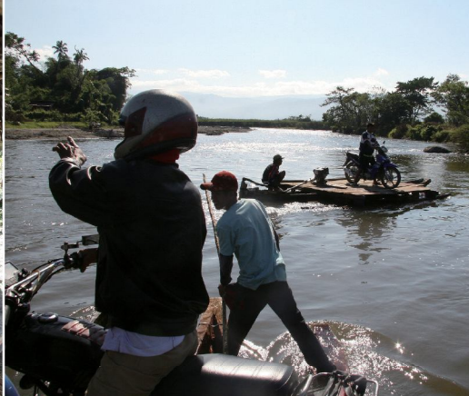
圖5：有些村落無法通行車輛，需靠出租摩托車（當地稱為Oje）始能抵達，這是無橋樑時渡河的情形。