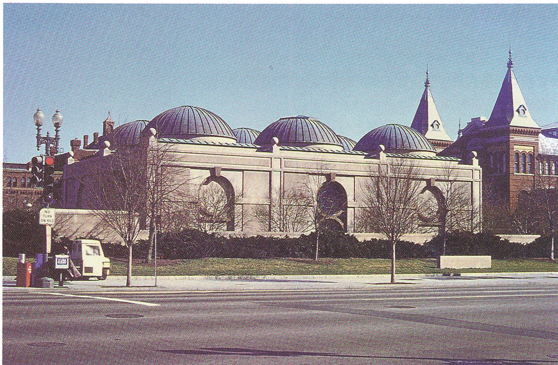
國立非洲藝術館全貌

館不僅地下室有通道相接，共用圖書館，研究及教育資料亦相互交流，達到資源與成果共享之目的。