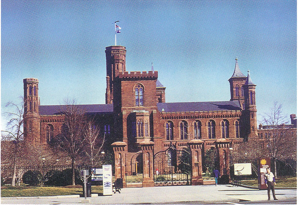
史密生機構管理中樞—城堡

經過百餘年之努力，史密桑尼機構已成為世上最龐大、最富盛名之博物館群機構。轄下有十四座博物館，主要分布於華府林蔭廣場附近。另有動物園、表演藝術中心等以及散布國內外之研究站多處，研究領域遍及天文、地理、海洋、生態、文化、藝術、歷史、機械文明等。目前擁有約六千名員工及五千名義工。典藏內容浩瀚無涯，自遠古之三葉蟲化石、史前人類使用工具至最先進之太空船皆在蒐羅之列，標本數達一億三千七百萬件。