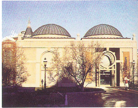
國立非洲藝術館正立面

依目前的瞭解，非洲人相信至高無上萬有之神的存在，也信奉祖先、自然力量等各種神靈，並將之納入日常生活習俗中。藝術之產生，與宗教間之關係相當密切。舉例言之，巫師以充填什錦木雕之占卜籃避凶或治病，常附帶利用木、泥土、金屬材料雕製物品做為與神靈溝通之信物；以人物雕像、容器等構成之祭壇，為物質世界與精神世界交流之場所；舞者之全套服飾與面具，可能代表祖先或自然神靈之化身，出現在慶豐收等社會儀式中；生長老病死的人生過程中，常以製作徽記、面具等誌其事。此外藝術亦與政治權位有關，統治者以雕像、徽章、特殊服飾、珠寶等來象徵其權