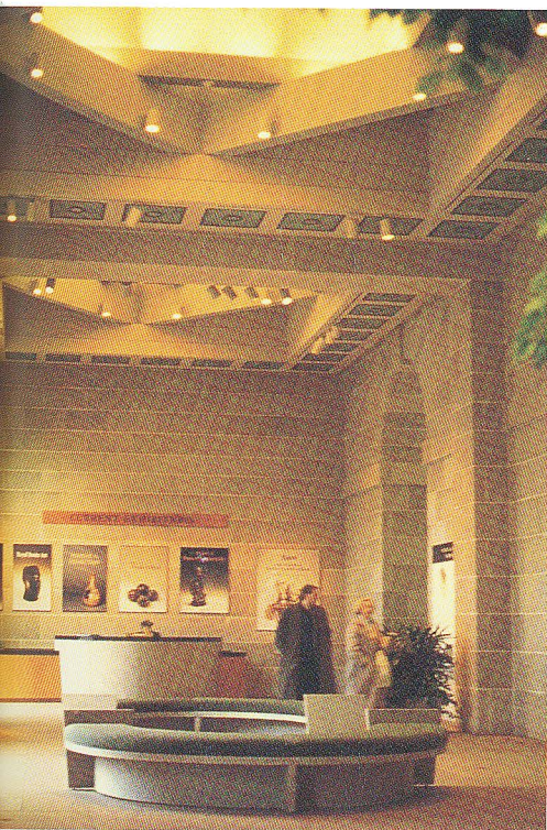
國立非洲藝術館入口大廳

1990 Official Guide to the Smithsonian. Washington, D.C. Smithsonian Institution Press.