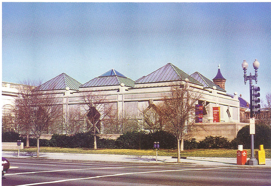
沙可樂美術館全貌

史密桑尼熱帶研究所 ( Smithsonian Tropical Research Center )