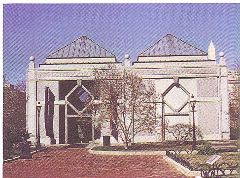
沙可樂美術館正立面

為增強本身之特色，彌補館藏不足之缺失，沙可樂美術館經常以借展及動態活動如解說、專題演講等來活絡其經營運作。且由於蒐藏研究方向與隔鄰之弗立爾美術館雷同，兩